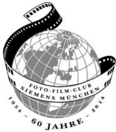
Foto-Film-Club Siemens München e.V.