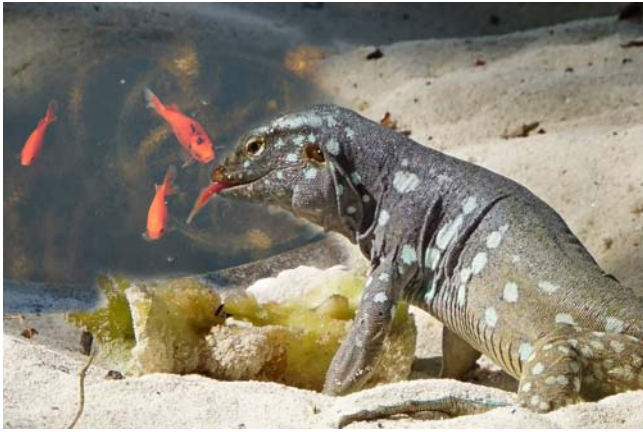
Rang 3: Jutta Giese - "Fische-Leguan"