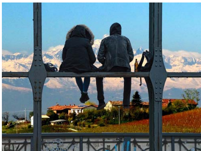
Rang 2: Inge Donzey Köfferlein - "Unerwartete Aussicht"