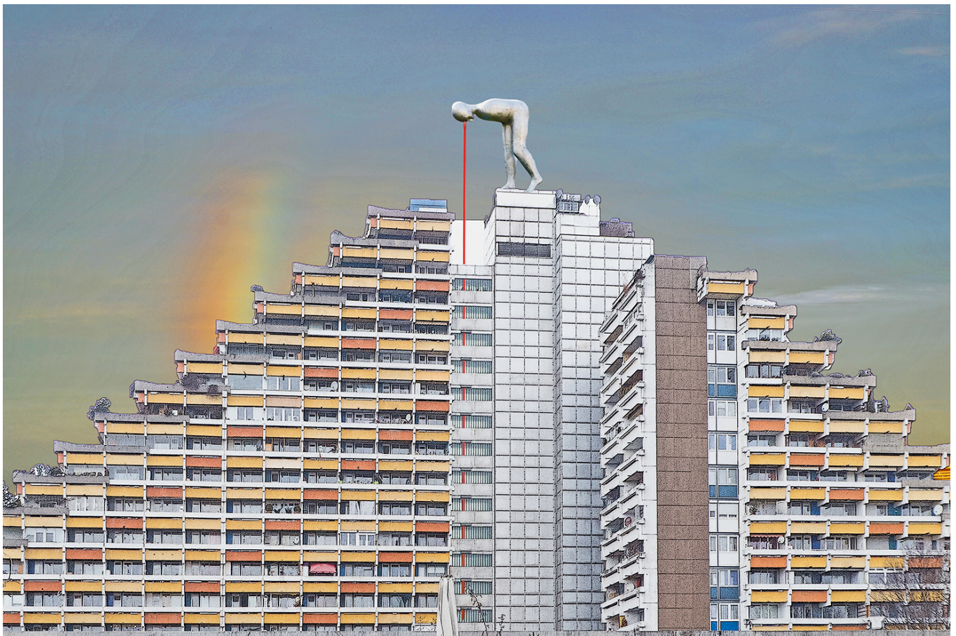
"Der große Durchblick, Rang 1 im Quartalswettbewerb "Montagen"