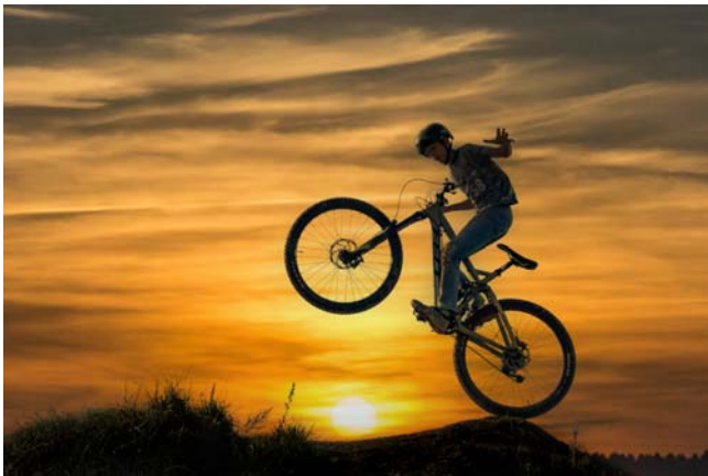
Rang 3: Rainer Köfferlein