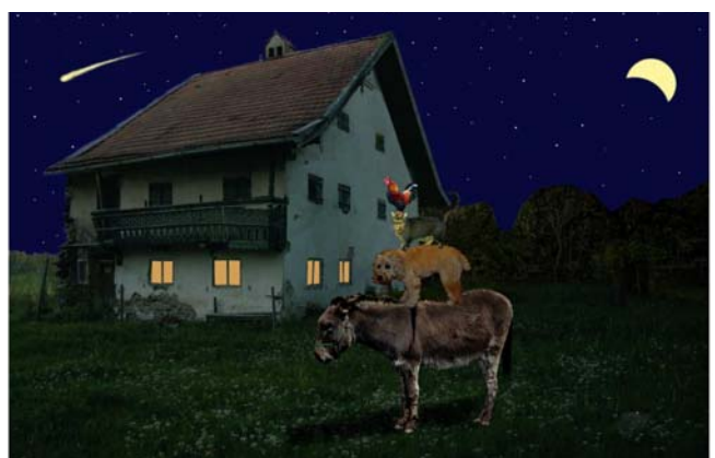
Rang 3: Emo Strohal