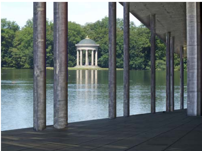
Rang 3: Inge Donzey - "Nymphenburg - natürlich nicht"

Nach dem Wettbewerb ist vor dem Wettbewerb.