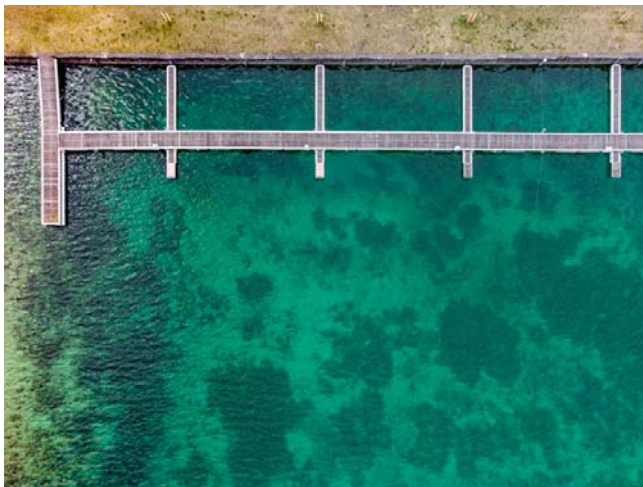
Regatta